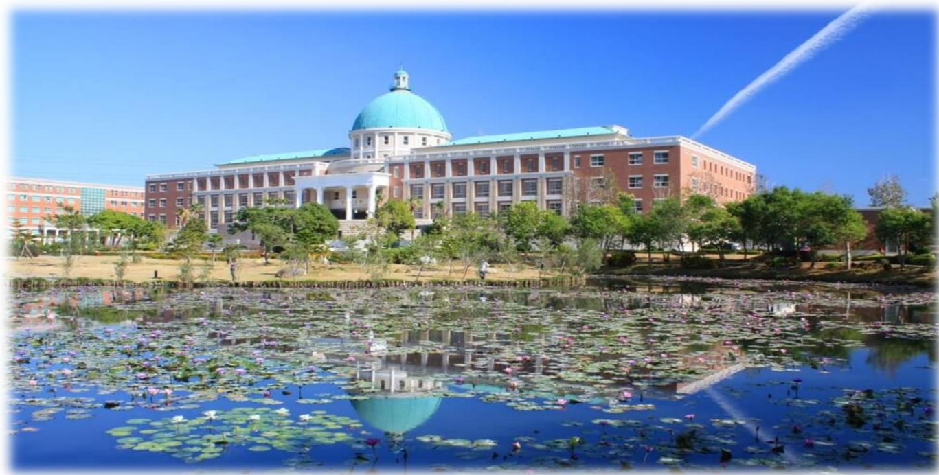
圖：就讀亞大，就是就讀一所「綜合大學」+「醫學大學」+「國際大學」